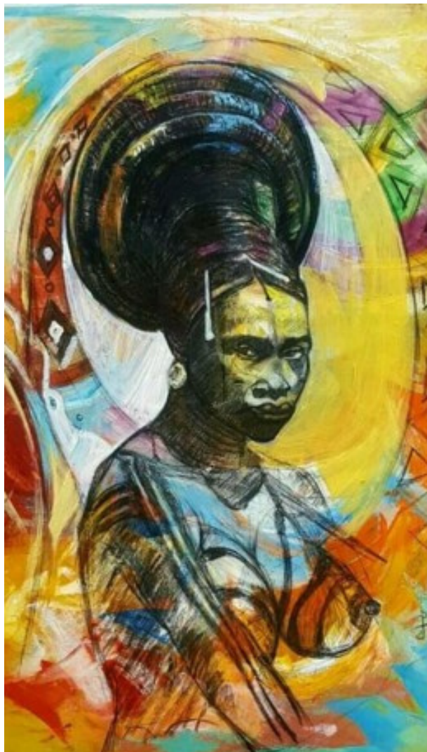
La reine nourricière, Huile et fusain sur toile - Série Mangbetu